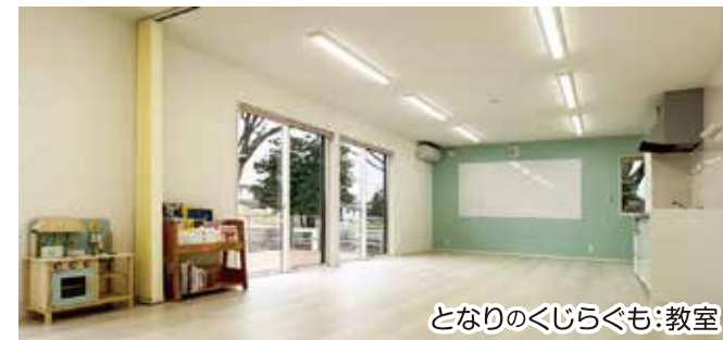
となりのくじらくも:教室